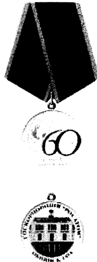
Рисунок юбилейной медали «60 лет атомной энергетике»