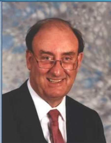
Лорд Маршалл Горинг